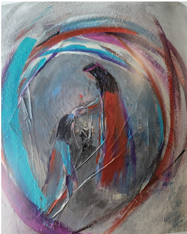
Frau aus Betanien