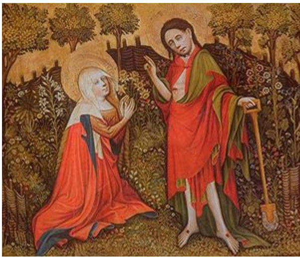
Meister des Göttinger Barfüßeraltars Auch Meister der Hildesheimer Magdalenenlegende genannt Master of the Göttingen Barfüßeraltar Also known as Master of the Hildesheim Legend of Magdalen tätig im 1. Viertel des 15. Jahrhunderts in Hildesheim und Göttingen