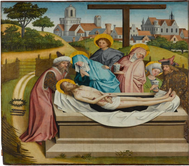
Meister der Sterzinger Altarflügel Master of the Sterzing Altar Panels tätig 1427 – 1467 in Ulm