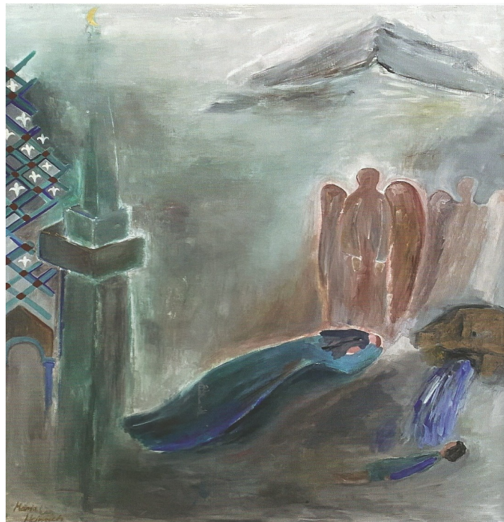
Hagar Saras Magd